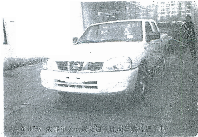
A1H75V 成都市公安局交通管理局车辆管理所制

号牌号码 川A1H75V 车辆类型 轻型普通货车 Plate No. Vehicle Type 所有人 四川省川南高等级公路开发股份有限公司 Owner 住址 四川省成都市武侯区二环路西一段90号四川高速大厦11楼 Address 使用性质 非营运 品牌型号 尼桑牌ZN1034U2G5 Use Character Model 四川省成都 车辆识别代号 LJNTGU2G7FN109877 市公安局交 发动机号码 857216X 通警察支队 Engine No. 注册日期 2015-12-21 发证日期 2015-12-21 Register Date Issue Date